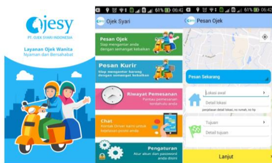
Gambar 1. Tampilan Aplikasi OJESY

ditampilkan pada gambar 1. OJESY menerapkan sistem sharing economic dengan pengemudi yang terdaftar dalam OJES. Pengemudi atau rider dalam OJESY disebut Sahabat Pengendara. OJESY sangat selektif dan menekankan syarat-syarat formal maupun syariah yang ketat untuk menjadi Sahabat Pengendara antara lain 1) Muslimah berjilbab dan berpakaian longgar, 2) Mempunyai SIM C, 3) Mempunyai kendaraan motor dengan kondisi keamanan motor dan surat yang lengkap, 4) Bisa berkendara dengan baik dan aman, 5) Mempunyai smartphone android minimal versi 4.2 dan mampu mengoperasikan chat whatsapp, 6) Mendapatkan ijin bergabung oleh suami/ayah/ibu/saudara, 7) Usia maksimal 40 tahun, 8) Pembagian fee untuk pengendara : 80% dari tarif ojek per kilo meter, 9) Tidak menerima jasa kurir dan antar pemesanan makanan atau material lainnya yang mengandung bahan non-halal.